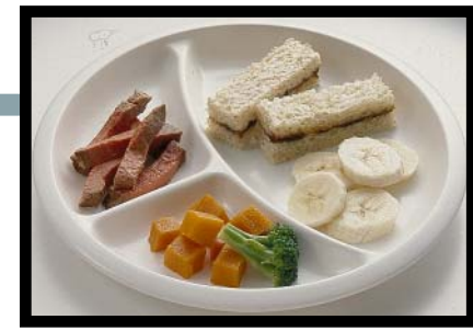
MITH TIN CAMKE KE YET (tin kiepke) Ke Kam päthni 9-12 ba mieeth kä dioc

Mi téeke mi la riek a noonj en dhör emo, ba cak, rec, ke tin diaal tin teke bel reydien ganj piny amäni path danj 12.